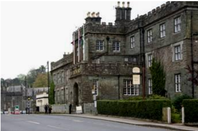
Hotel Bedford in Tavistock (ehemalige Abtei)

Das Ambiente und das Dekor vom Hotel erinnern an historische Zeiten. Schlendern Sie nach dem Nachtessen durch die Gassen der kleinen Stadt Tavistock und besuchen Sie eines der schönen Pubs.