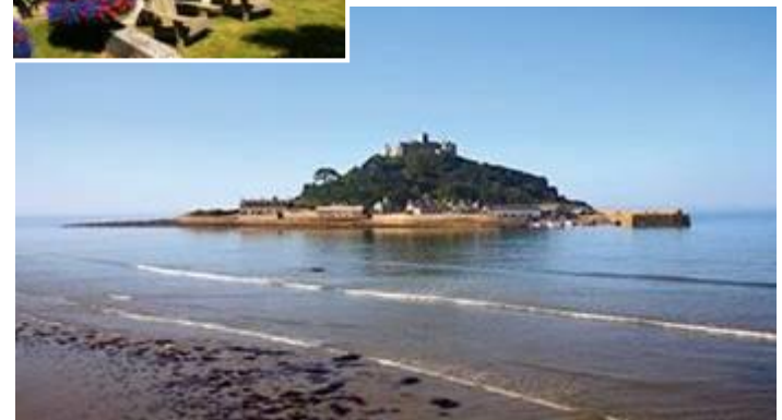
St. Michaels Mount Klosterinsel